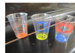
ペンで色を付けたら…