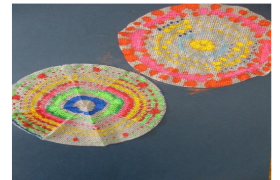
広げて暗い画用紙に貼れば 世界に一つだけの花火の完成!