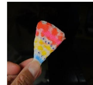
色を自由に染み込ませ…