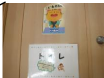
ひろば内 こども用