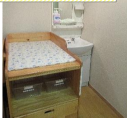
オムツ替え・手洗い