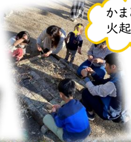
かまどを組んで火起こし中です。