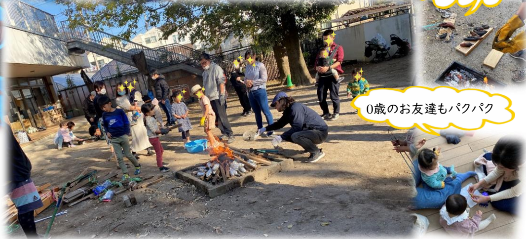
0歳のお友達もパクパク