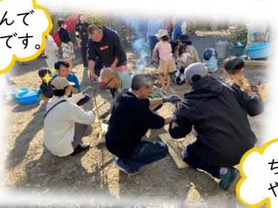
ちょっと焦げたやきいも!