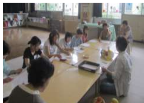
発達に合った遊びとは？みなさん考え中・・・