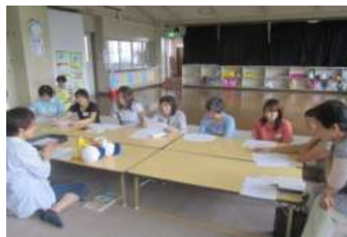
初めてのうた♪楽譜とにらめっこテスト