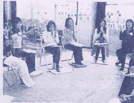
《こころと体のリラックス講座》 自分の体と命に感謝してリラックス…♡

何度も託児体験を下さったり、いつもボランティアで協力して下さいるサポート会員さん、本当にありがとうございます。感謝!!