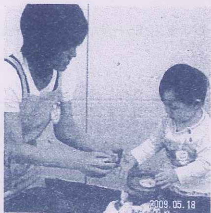
《保育体験中》ママゆっくり楽しんでね!