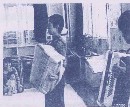
《ひだまりコンサート》